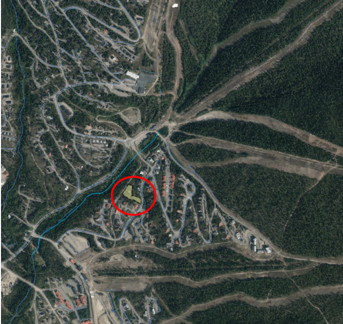
Planområdets lokalisering i Björnrikeinom röd ring.