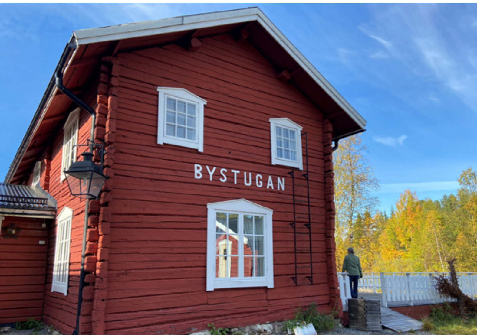
Den lokala utvecklingsplanen för Lofsdalen presenterades 11 juni 2024